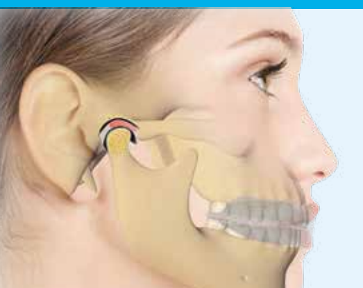
Traitement des troubles de l'ATM

UN PROGRAMME DE FORMATION COMPLET POUR LES ASSISTANTS(ES)